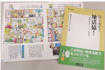
まちづくりセンターで配布中 (浪速区役所 6F)

この度、浪速区まちづくりセンターでは、地活協が行なっている地域の取り組みをマンガで分かりやすく紹介するパンフレットを製作しました。まちづくりセンターのホームページでも閲覧できます。ぜひご覧ください。